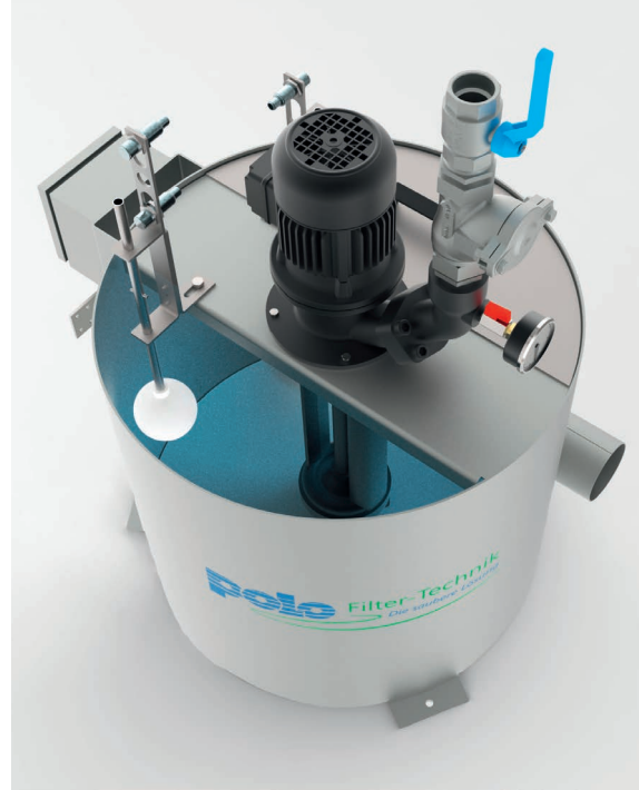
Réservoir / Tank

Les illustrations montrent partiellement les équipements additionnels. Some of the photos show additional equipment.